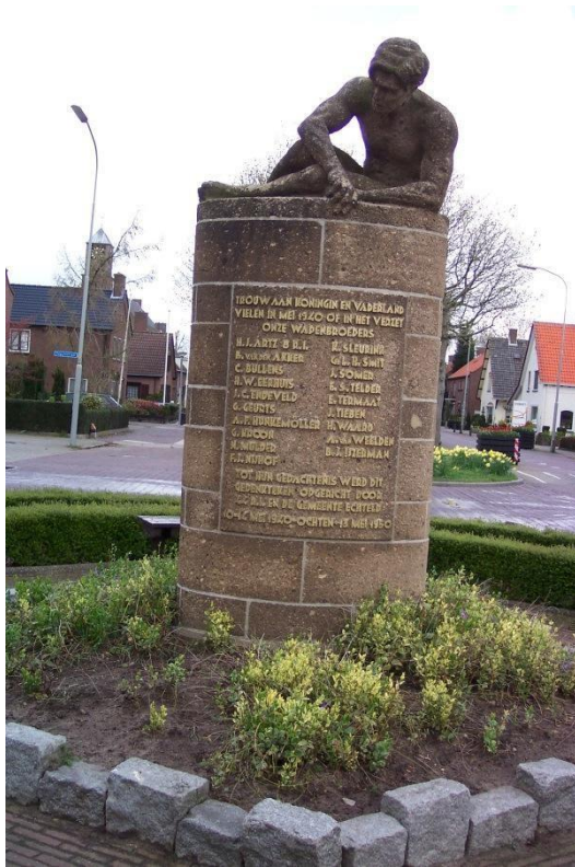
Bij dit herinneringsmonument verzorgt het plaatselijke 4&5mei Comité Ochten-Eldik elk jaar op 4 mei een herdenking.