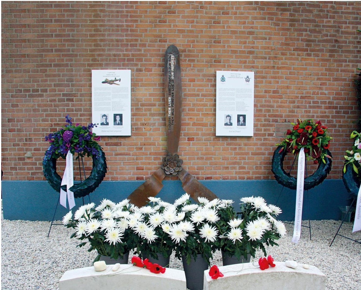
De drie propellerbladen zijn een eenheid. In het rechte blad zijn de woorden gestanst:

Though their lives ebbed away in our soil They will forever live in our memories.