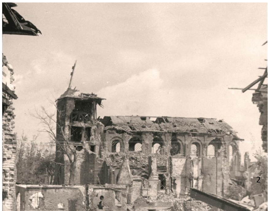
De voormalige Hervormde kerk van Ochten na de Tweede Wereldoorlog

Ongeveer 350 geallieerden en ongeveer 1000 Duitse soldaten zijn in onze gemeente gesneuveld. Ook had elk dorp enkele tientallen burgers te betreuren die door oorlogshandelingen waren omgekomen. Het herstel van de wegen en van de dorpen zou nog tientallen jaren duren. De oorlog had bij de bevolking diepe sporen achtergelaten.