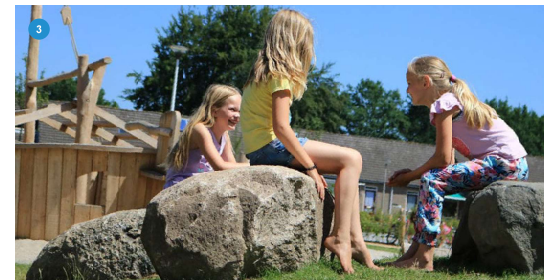
STAP- EN ZITKEIEN