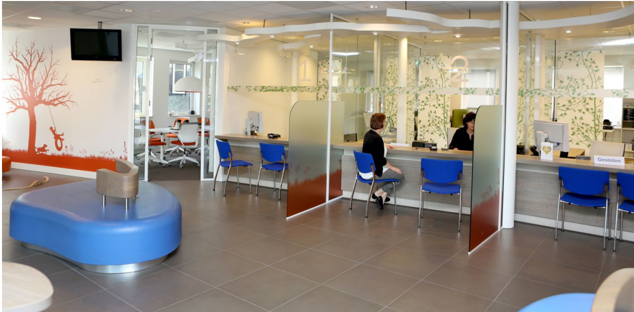
Centrale hal en Gemeentewinkel in het gemeentehuis Neder-Betuwe

Van buiten naar binnen werken, het geldt ook voor onze dienstverlening en voor het uitvoeren van taken op het gebied van de Wmo, Participatiewet, Jeugdwet en de begeleiding naar werk. Kernwaarden voor onze dienstverlening zijn: interactief, proactief, betrouwbaar en persoonlijk. Dat laatste vertaalt zich onder meer ook in buurtbezoeken en bedrijfsbezoeken die de gemeenteraad aflegt zodat uit de eerste hand vernomen wordt wat er zoal leeft bij inwoners en ondernemers. Verder is er ondersteuning van en dialoog met maatschappelijke organisaties zoals kerken en buurtverenigingen die de belangrijke verbindende schakel zijn tussen (kwetsbare) inwoners en de gemeente.