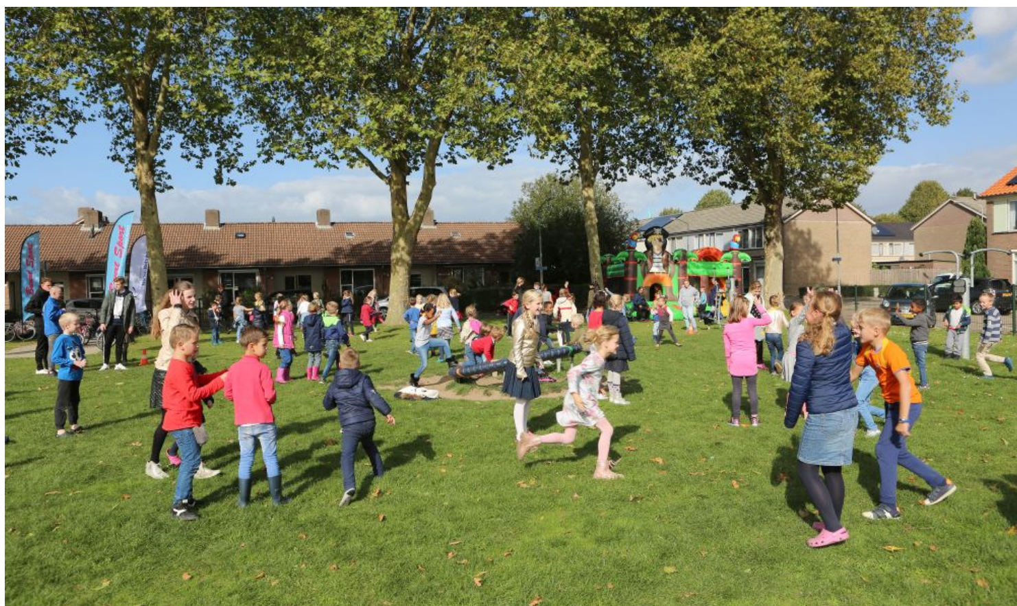
Spelmiddag 'Neder-Betuwe bloeit'

Met deze Visie 2030 werkt de gemeenteraad Neder-Betuwe in samenwerking met inwoners, organisaties en ondernemers het komende decennium aan een bloeiende gemeente waarin omzien naar elkaar vanzelfsprekend is.