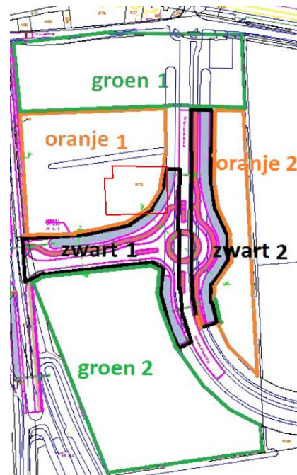
Afbeelding 2b Planinrichting ABC-terrein met vindplaats

Op afbeelding 2b is ook de vindplaats aangegeven (rode contour). De gemeente wil graag met de uitgevoerde archeologische onderzoeken antwoord op de volgende vragen: